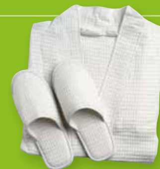
ZESTAW KĄPIELOWY SZLAFROK + KAPCIE