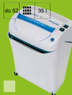
Niszcarka WALLNER L-312 1.090 00