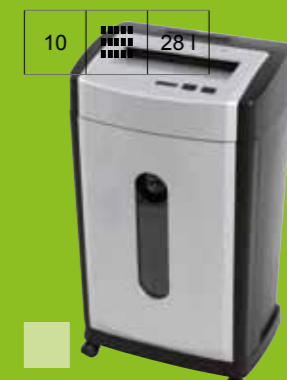
Niszcarka WALLNER III-S 1.390 00